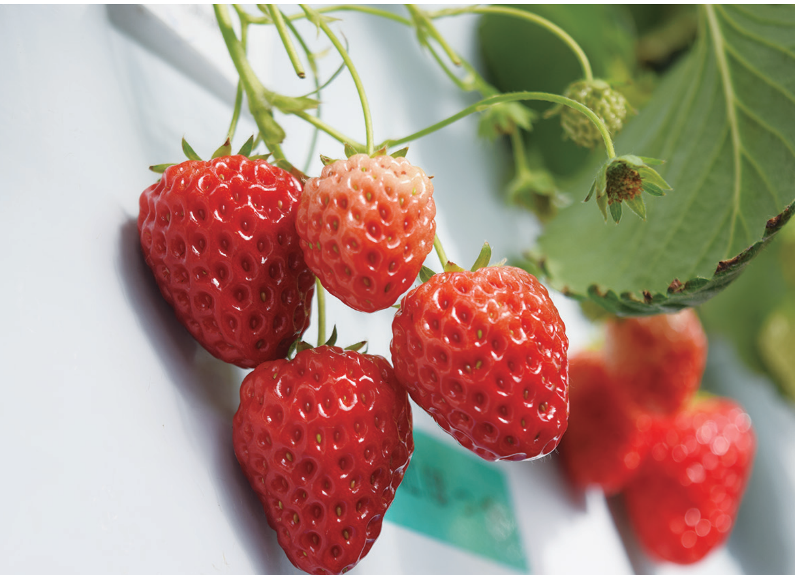
イチゴの水耕栽培(本学・ガラス温室)