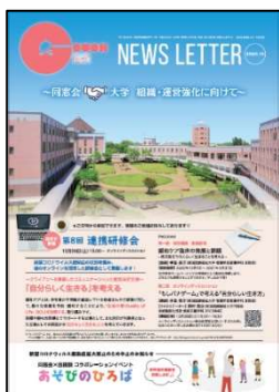
【伍桃 NEWS LETTER】

10月に同窓会誌「伍桃 NEWS LETTER」を発刊、3月に「伍桃No. 17」を刊行しました。同窓生の近況や大学情報および大学院案内等が掲載されています。