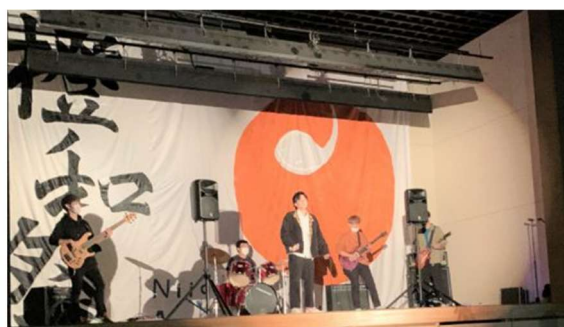
【大学祭は動画配信とのハイブリットで開催】

また11月には、参加人数を限定し、動画配信とのハイブリットによる大学祭「橙和祭」