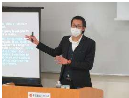
【ビジネスプラン・研究成果発表会の様子】