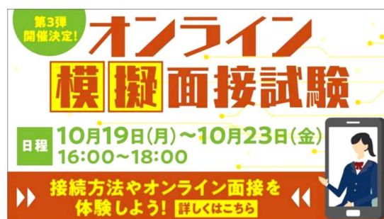
【オンラインでの広報活動を展開】