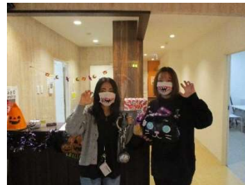
【ハロウィンイベント(仮装撮影)】