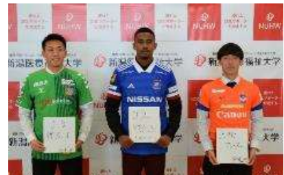
【Jリーグ・シンガポールリーグクラブ入団会見