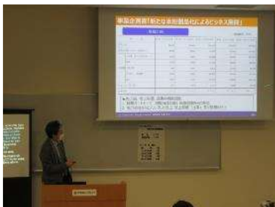
【ビジネスプラン・研究成果発表会の様子】

本学では毎年「事業創造」の実践家/研究者の育成を行うために事業計画/研究成果を学内外に公表する場を設け、不足資源や助言獲得の機会として、また計画/研究のブラッシュアップにつなげることを目的として「ビジネスプラン・研究成果発表会」を実施しております。2020年度は2021年2月27日（土）に外部審査員9名をお迎えして5名の本学学生が発表を行いました。