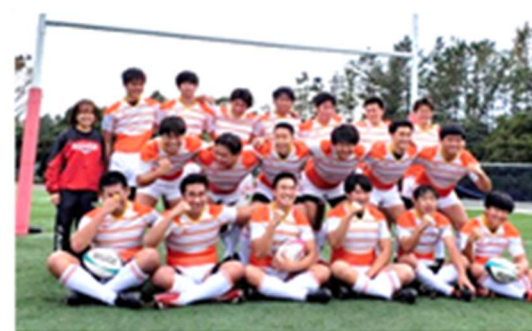
【男子ラグビー部始動！】