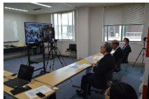
【宜蘭県政府消防局記念式典（オンライン）】