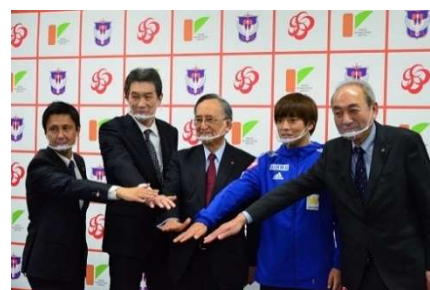
【連携協定記者発表】

2021年3月、本学とアルビレックス新潟、アルビレックス新潟レディース、新潟リハビリテーション病院の4者間で連携協定を締結しました。今後、本学の研究機能と新潟リハビリテーション病院の医学的管理機能を融合し、医科学的側面からアルビレックス選手の食事や栄養、リハビリテーションなどのサポートを進めていきます。