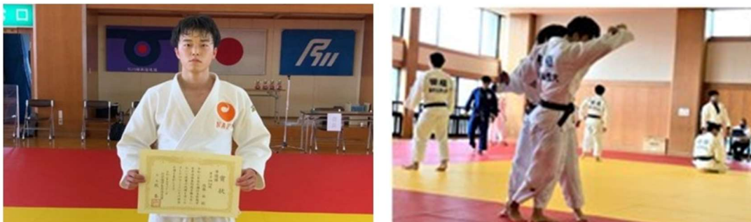
【柔道部始動！北信越大会にて見事準優勝！】