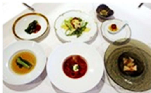
【ホテルイタリア軒シェフによるイタリア野菜メニューの試食会】