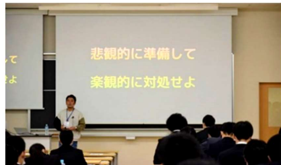
【NAFU JOB 博での就職講演会】

また12月には就職支援に係る学内イベントとして「NAFU JOB博～ジブンノミライ～」を企画・開催し、就職講演会および企業の人事担当者による業界職種説明会を実施しました。