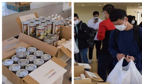
【フードバンクにいがたによる食糧支援】

その他、オンライン授業の実施に伴う在宅時間の長期化や学生同士の交流機会の減少等による心身への影響を踏まえ、心理相談・医務相談のオンライン化や臨床心理士によるメンタルケア動画の作成・配信を行ったほか、家計急変やアルバイト収入の減少など経済的な影響を受けた学生を対象とした教職員による学生支援寄付金の創設、フードバンクにいがたとの連携による食糧支援等、多面的な支援を実践しました。