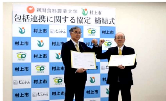
【村上市と包括連携協定を締結】

これにより、本学の連携協定先は「胎内市・JA胎内市」、「糸魚川市」、「新発田市」、「村上市」の4市および「株式会社政策金融公庫新潟支店」の1社となりました。