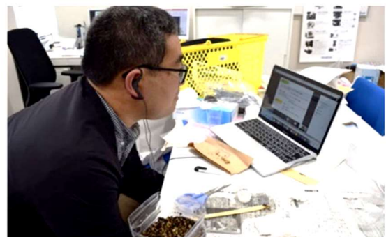
【オンライン授業を実施】

また、過去2年間の学修効果等を踏まえて、資格取得に係る新規科目の追加や担当教員の追加等の教育課程編成の改善に取り組んだほか、オンライン授業の質向上に向けて、学生・教員への授業アンケート、教員相互の授業見学、FD研修など、さまざまな取り組みを実践しました。