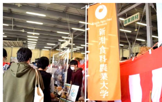
【秋の総合展示会・収穫感謝祭へ出店】

学内の圃場・実験室等を利用し、農作物の生産・加工から販売までを研究・実践する学生クラブ「6次産業化クラブ」の活動の一環として、J A胎内市が主催する「秋の総合展示会・収穫感謝祭」に出店しました。学生は、自ら栽培したきゅうりやダイコン等の販売を通じて、6次産業を実践的に体感することができました。