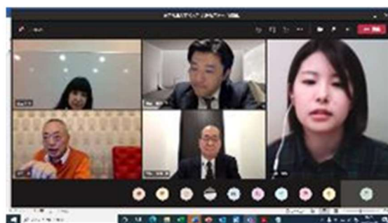
【女性起業家育成塾の様子(2021.02.26)】 ※TV 会議システムTeams を使用しての発表・質疑応答