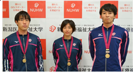
【第89回日本学生陸上競技対校選手権大会