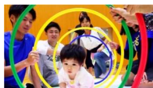
【大学とのコラボ授業】