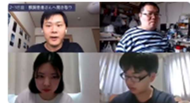
【ディスカッションの様子】