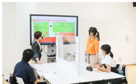
【来場型でのオープンキャンパス】

その他、指定強化クラブの情報発信およびスカウティング活動を推進したほか、キーワード戦略（健康、栄養、商学、経営など）に基づく広報ツールの作成およびSEO外部施策（検索連動型広告等）を実行し、食・農・ビジネス分野の広義的な関心者への大学発見・認知機会の増大および新規志願者層の獲得に努めました。