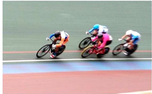
【インカレ 男子ケイリンにて見事6位入賞】