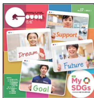
【伍桃 No. 17】