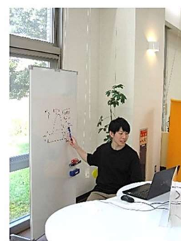
【オンラインによる個別指導の様子】

図書館のラーニングコモンズ内にある学習支援センターでは、専門科目の基礎となる数学・生物・化学・物理などの理系科目の復習や、高等学校で未履修であった科目のサポートのほか、レポートの書き方や論作文の指導などを行いました。また、多くの学生が躓きやすい科目と連動したセミナーを通年で開催しました。図書館では、センターによる学習サポートと学術的な資料群の提供、グループ学習室や個人のブース席の整備などにより、学生の「学び」の総合的な支援を行いました。