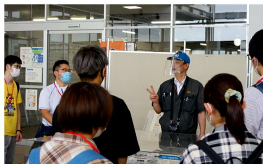
【新潟中央青果での研修】

早期から将来の就業イメージを高めることを目的に、農場、食品加工センター、青果市場、農家レストランなど、食料産業に関わるさまざまなフィールドを研修先とした体験型の学習を行いました。2020年度は、新型コロナウイルス感染症対策として、3グループに分散し実施しました。