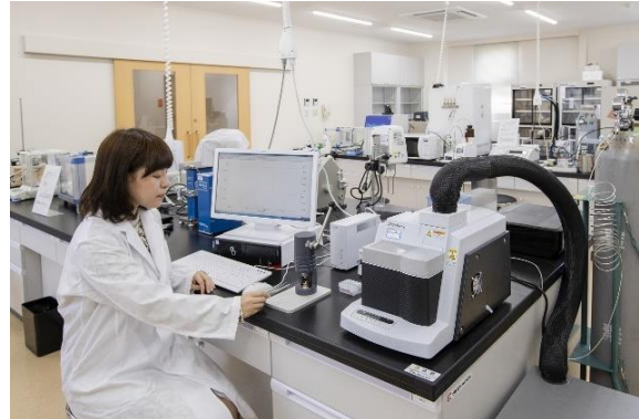
【高度な実験・研究機器を備えた実験室】