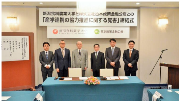
【日本政策金融公庫との協力推進の覚書締結式】