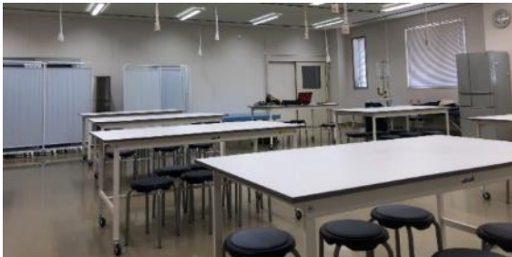
【3階 基礎工学実習室】