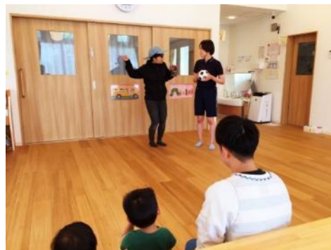
【学生とのコラボ授業】