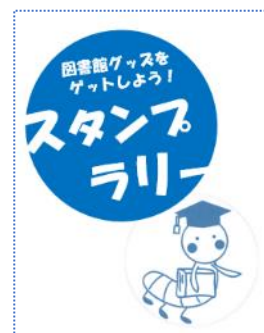
【図書館キャラクター“ブックワーム”】