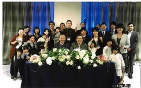
【理学療法学科1期生同窓会】