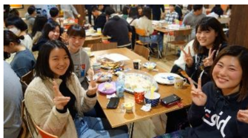
【クリスマスパーティーの様子】