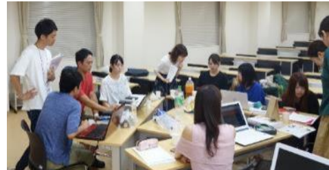
【連携総合ゼミ 同窓生からのアドバイスの様子】