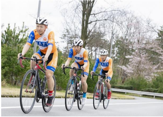
【強化指定クラブ自転車部の練習風景】