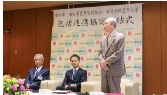
【胎内市・JA 胎内市との 3 者協定締結式】