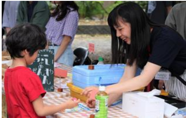
【基礎ゼミ I では胎内市の露天市「三八市」に出店】

胎内市の伝統的な露天市である「三八市」への出店（6月23日/7月8日）に向け、商品企画、仕入れ、利益計算などをすべて学生が行い、また出店後は活動成果や収支などを発表しました。