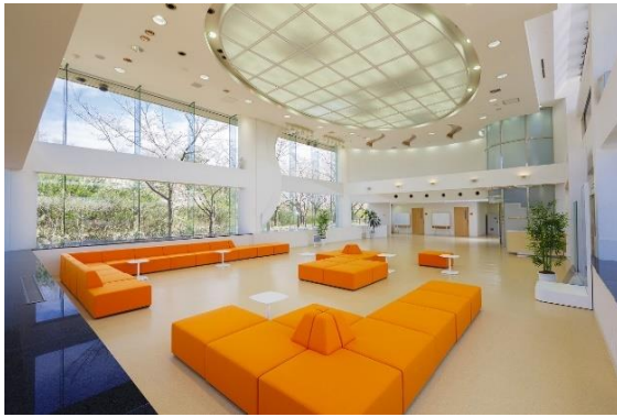
【オレンジを基調としたエントランス】