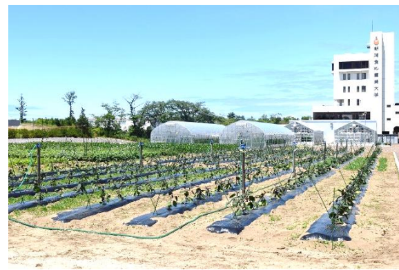
【学内の実習畑ではジャガイモや枝豆などを栽培】