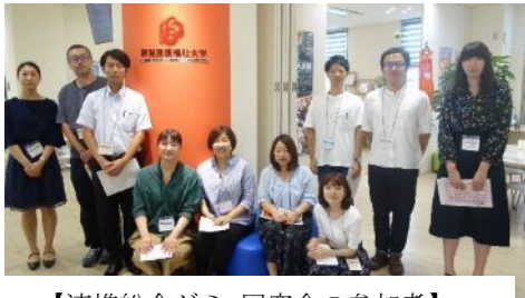
【連携総合ゼミ 同窓会の参加者】

2018年9月5日開催の「連携総合ゼミ」に同窓生10名が参加し、実際の臨床現場における多職種間連携の事例を紹介しながら、プレゼンテーション資料の作成についてアドバイスをを行いました。