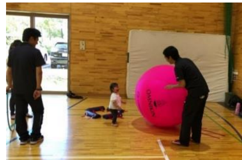
【ホームカミングデー「あそびのひろば」】