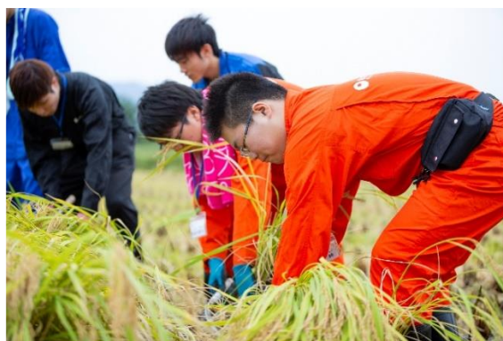
【農学基礎実習の様子】

2018年度は語学や情報処理等の教養を学ぶ「教養科目群」、食料産業の基礎を学ぶ「基礎科目群」、また本学の特色である食・農・ビジネスを一体的に学ぶ「共通科目群」の3つの科目群から計33科目を開講し、月曜日は新潟キャンパスで、火曜日から金曜日は胎内キャンパスでそれぞれの教育環境を活かした教育活動を展開しました。