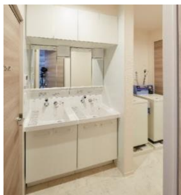
【住居棟 共用洗面・洗濯室】