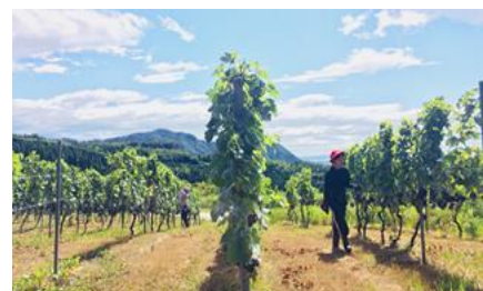
【ワイナリーでブドウ栽培を体験】

胎内高原ワイナリーの協力のもと、ワインブドウの栽培を体験しました。また醸造所の見学や販