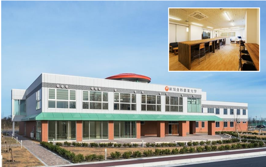
【新潟キャンパス（埋め込みの写真は、地域・産官学連携の推進拠点となる社会連携推進室）】

ビジネス系科目を開講する講義室、ゼミ活動を行う演習室、ビジネスコース教員の研究室のほか、社会連携の拠点となる社会連携推進室や就職センター、図書室、学生自習室等を整備しています。