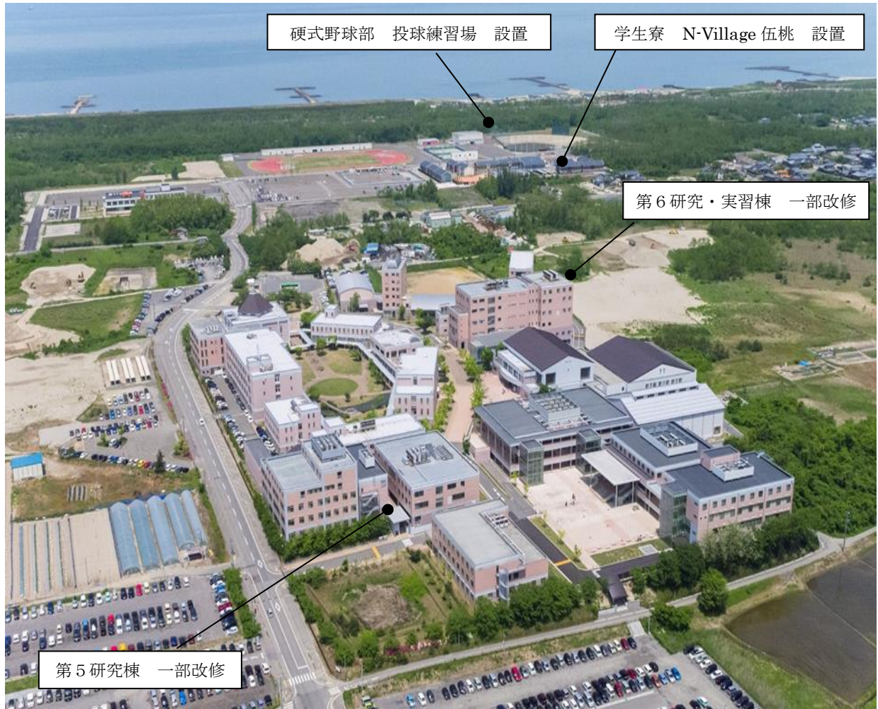
【新潟医療福祉大学キャンパス全景】