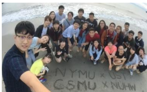
【English Campで異文化コミュニケーションを学ぶ】

※「English Camp」は、国内で海外体験をシミュレートできる環境を提供するイベントです。