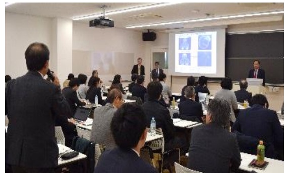
【1月22日 第3回アグリフードセミナー「容器開発が食料産業に与えるインパクト」】