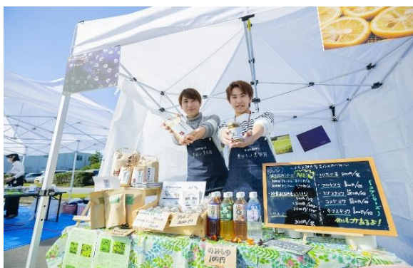
【初めての大学祭（橙和祭）の様子】

また11月4日（日）には、学友会命名による「第1回 とうわさい 橙和祭（大学祭）」を開催し、模擬店の出店や本学圃場での芋ほり体験、地域連携プロジェクトで栽培したマコモダケの販売などを行いました。