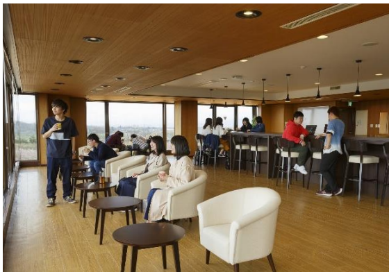
【日本海が展望できる学生ラウンジ】