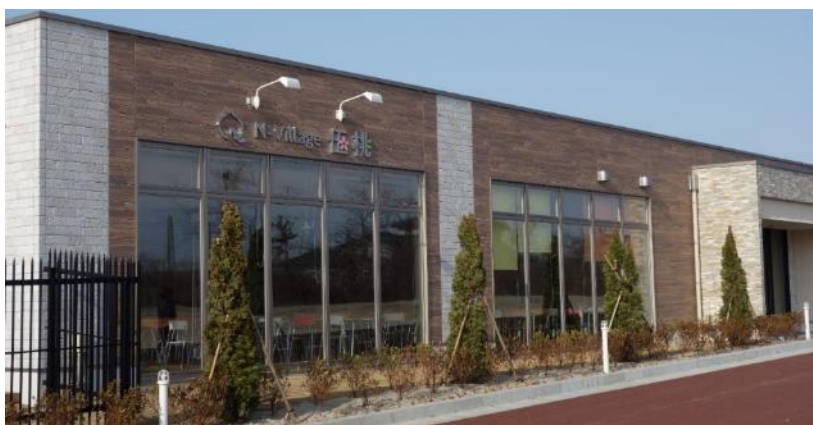
【N-Village 伍桃 外観】

2018年4月に開寮した学生寮「N-Village 伍桃」には、寮1期生299名が入寮しました。寮生による学生寮組織として、「学修プログラム委員会」「衛生委員会」「催事委員会」「広報活動委員」の4つの委員会を設置し運営を行いました。単なる生活の場としての機能にとどまらず、将来、QOL サポーターとして働くための基礎となる学修プログラムおよびレクリエーションなどを開催し、寮生活を通じた人材育成にも力を入れています。