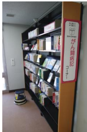
【がん闘病記コーナー】