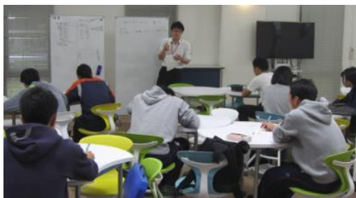
【ラーニングcommonsでのセミナーの様子】