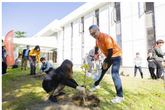
【橙和祭の「橙」にちなんでミカンの木を植樹】