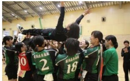
【春季北信越学生バレーボール選手権 優勝】