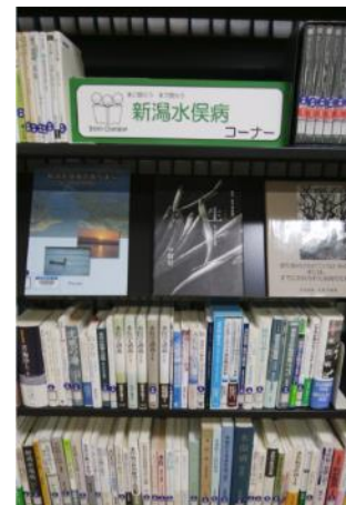
【新潟水俣病コーナー】