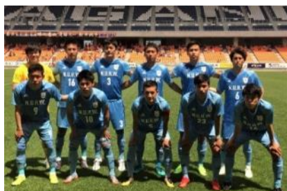
【天皇杯 1 回戦 AC 長野バルセイロ戦 (J3)】