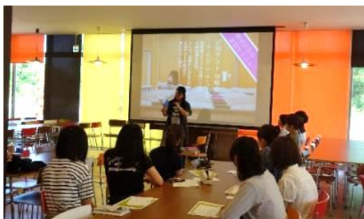
【定期テスト攻略会の様子】