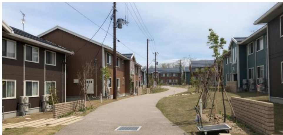
【寮敷地内風景 ※第2期工事区画内】

本学生寮は単なる生活の場としての機能にとどまらず、将来、QOLサポーターとして社会で活躍するための基礎となる学修プログラムやレクリエーション等を提供していきます。