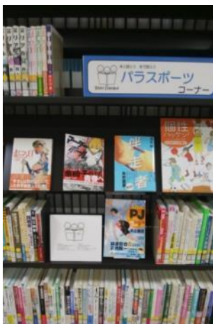
【パラスポコーナー】