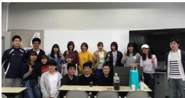
【第1回秋田県人会開催時の写真】