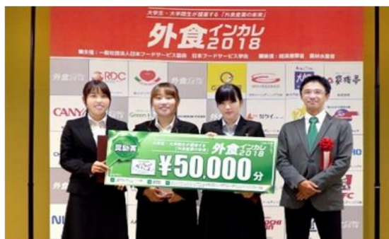
【出場チーム唯一の本学1年生チーム】