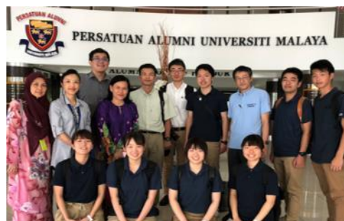
【全学科対象の海外研修（マレーシア）】