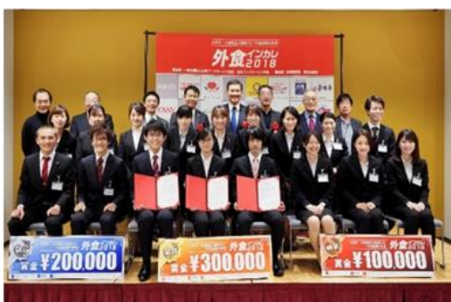
【外食インカレ2018で見事4位受賞！】