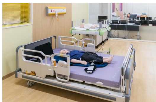
【乳児・小児シミュレーター】