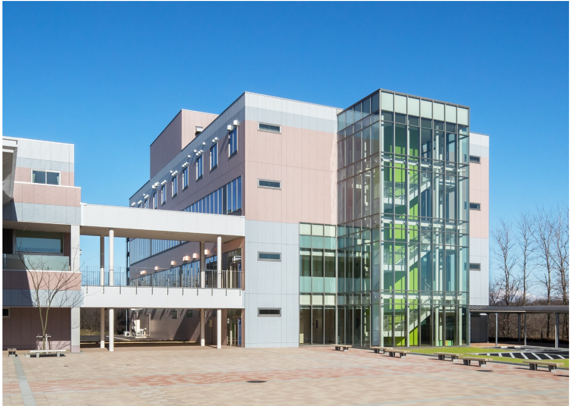
【第10研究・実習棟 外観】