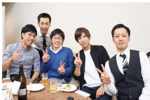
【理学療法学科3期生同窓会】