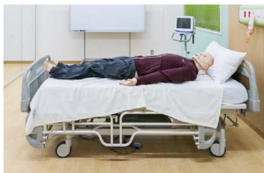
【成人シミュレーター】