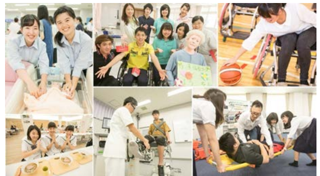
【夏のオープンキャンパスの様子】

これらの取組みにより、2017年度の各種実績（受験学年）は、資料請求数19,487件（前年比110.3%）、オープンキャンパス受付け数3,758件（前年比105.4%）、入学志願者数4,137件（前年比110.1%）といずれも前年度を上回る結果となりました。特に、専願制入試であるAO・推薦入試における志願者数では前年比112.1%の増加となり、本学を第一志願とする志願者の拡大を達成できたほか、首都圏（東京・埼玉）からの志願者数の増加（同279.3%）および県外志願者数の増加（同121.5%）を達成することができました。