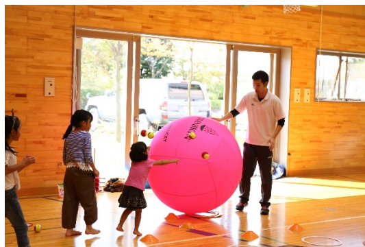
【ホームカミングデー「あそびのひろば」】