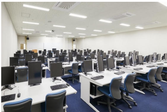
【3階 画像情報学実習室】