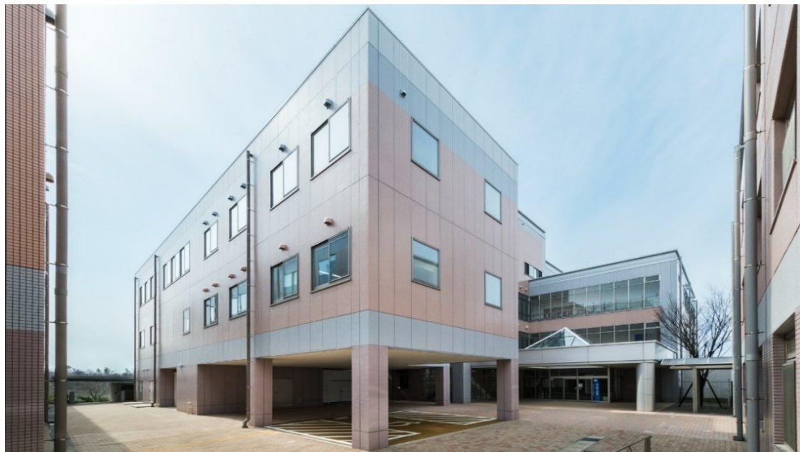
【第4研究・実習棟 増築部外観】

これにより、臨床現場さながらの実習環境を整えることができたとともに、本学の特徴である「連携教育」にも活用されることが期待されています。