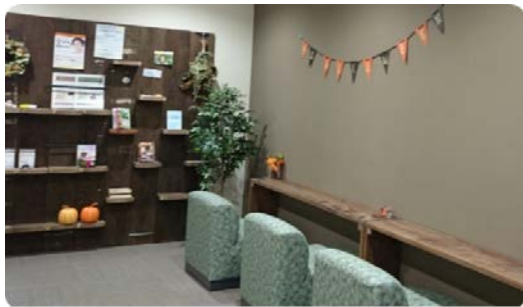
【ウェルカフェの改修】