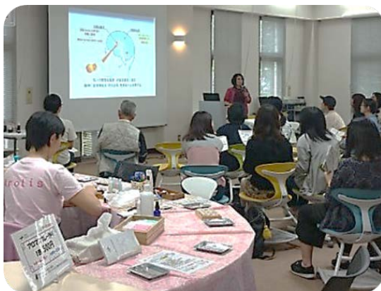
【学園祭企画 アロマセラピー講習会】