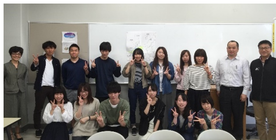
【第1回北陸圏人会開催時の集合写真】