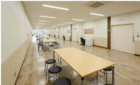
【1階 メディカルイメージングセンター】