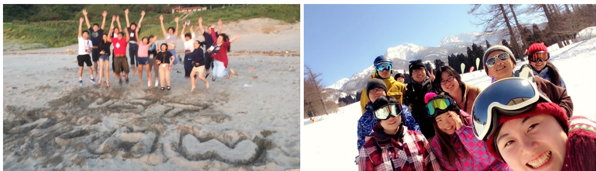
【English Camp で異文化コミュニケーションを学ぶ】

※「English Camp」は、国内で海外体験をシミュレートできる環境を提供するイベントです。