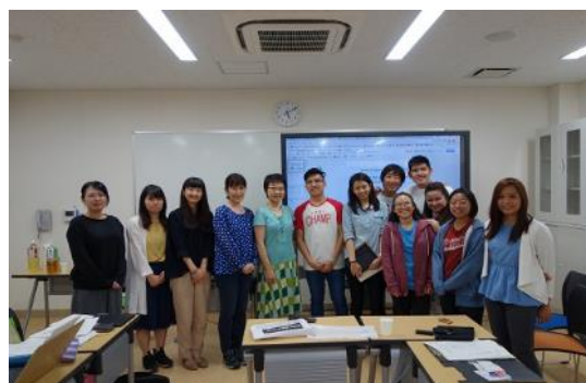
【連携総合ゼミグループ写真】

本学では開学時より学部・学科の枠を越えて学ぶ「連携教育」に力を入れています。そのため、将来「チーム医療・チームアプローチ」の実践に必要な資質の修得に関連した科目を充実させています。連携教育の集大成となる「連携総合ゼミ（4年次開講）」では、本学の学生の他、新潟薬科大学、日本歯科大学新潟短期大学および新潟リハビリテーション大学、海外からはアンヘルズ大学（フィリピン）およびセント・トーマス大学（フィリピン）の学生ならびに陽明大学（台湾）の教員・学生が参加して専門職種間連携教育に関する活発な議論などが行われました。