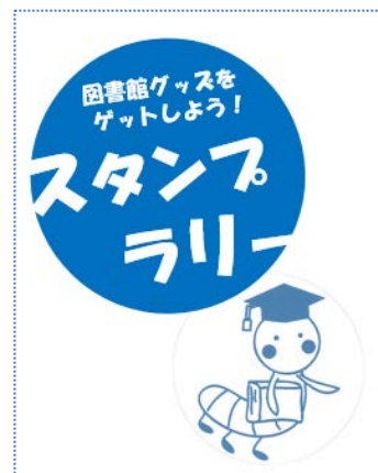
【図書館キャラクター“ブックワーム”】