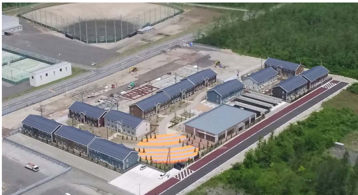
【N-Village 伍桃 第1期工事全景】