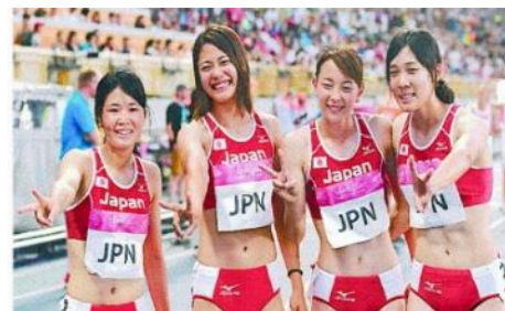
【第29回夏季ユニバーシアード