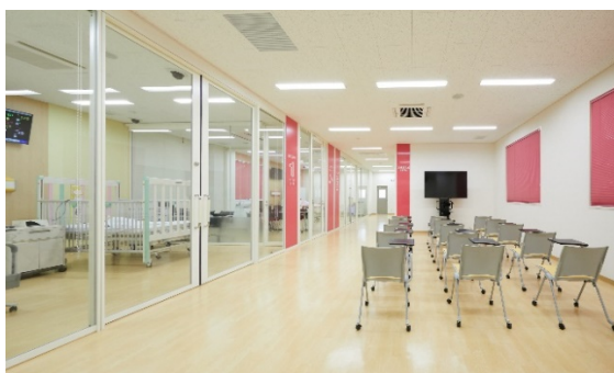
【2階メディカルシミュレーション教育センター】