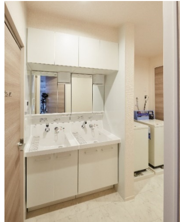
【住居棟 共用洗面・洗濯室】