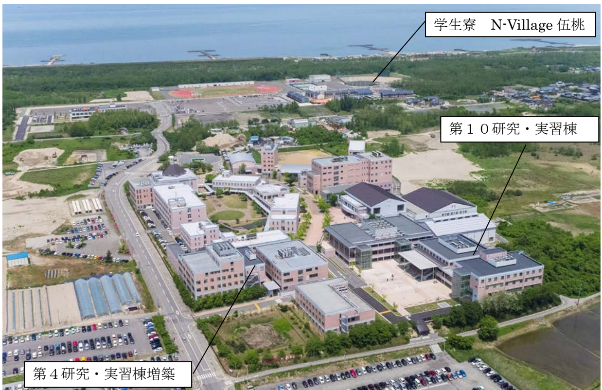
学生寮 N-Village 伍桃