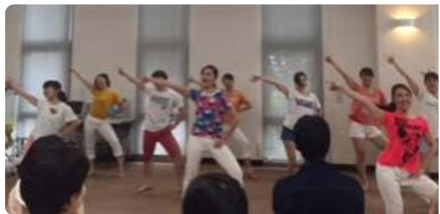
【ワークショップ ストレッチ in 図書館】