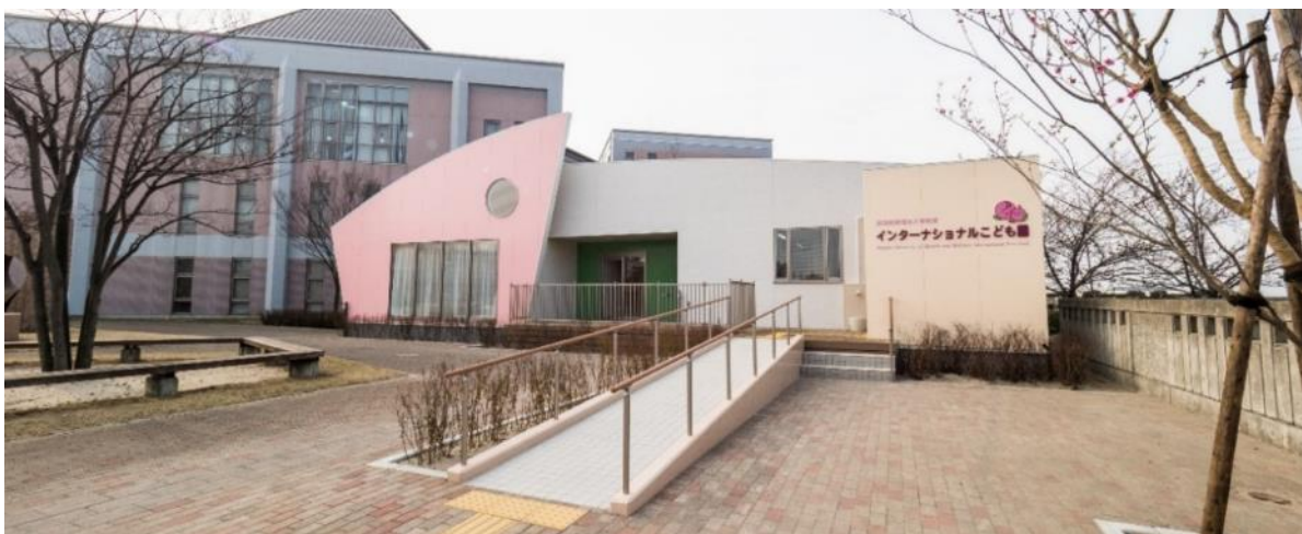
【インターナショナルこども園 外観】