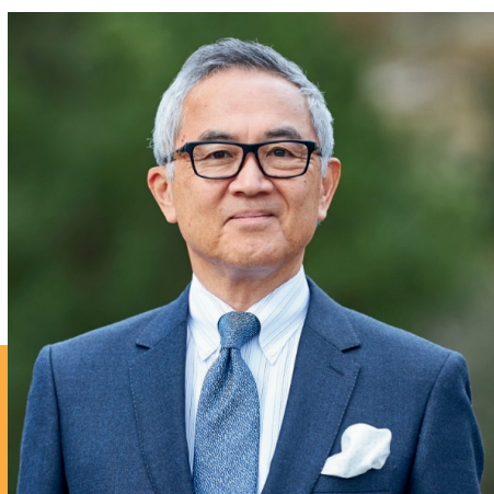
講師：新潟食料農業大学 学長 中井裕