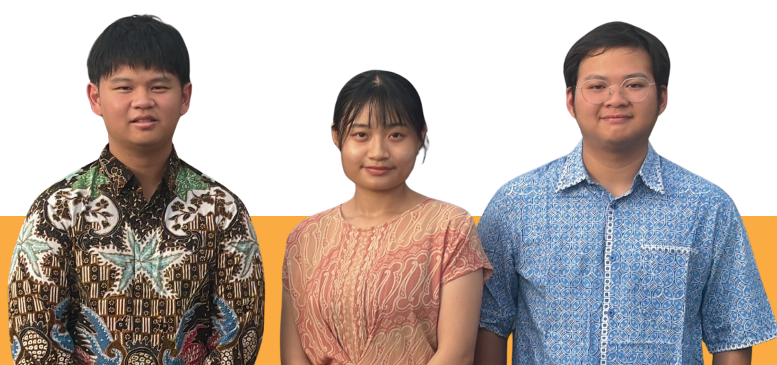
説明を担当するインドネシアからの留学生の皆さん。

お申し込みはこちらから 締め切り：10月27日（月） zoom配信参加の方には、 後日EメールでURL等を送付します。