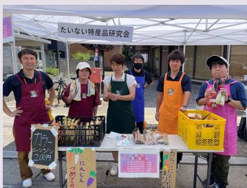
マルシェで試食販売！ 認知拡大に挑戦！