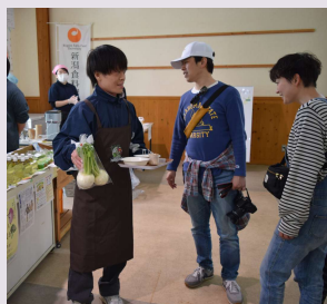
収穫体験会企画に挑戦！