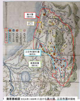
藩界地図 文化の年(1809年)における黒川藩、三日市藩の藩地 黄色の○印は新潟食料農業大学による調査(2022～2023年)で伝内柿確認した地点

新潟食料農業大学・松本ゼミ（果樹園芸学）が、旧中条町・黒川村・新発田市の古い資料と地図を片手に、地域の畑や集落を訪ね歩きながら探索調査を実施。その調査から、伝内柿が旧黒川藩・三日市藩の地域にだけに分布する品種であることを明らかにしました。胎内市・新発田市周辺だけに残る、唯一無二の“希少在来品種・伝内柿”。市民の「この柿、伝内？」の声が、学生により伝内柿の魅力の一つと裏付けられました。