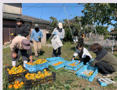
▲地域の方から干し柿の吊り方を教えてもらいました

柿の中でも抜群に甘い。でも時々渋い果実が発生。それは、「不完全甘ガキ」の特性であることを明らかにしました。