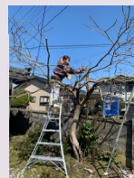
▲約100年生の古木を剪定で若返らせよう！！